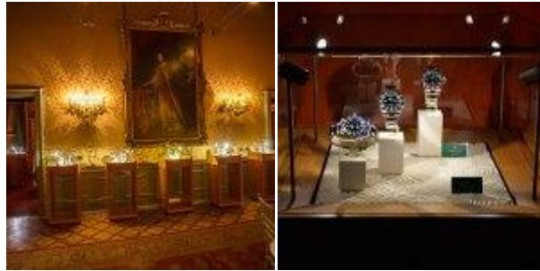
Le vetrine Rolex alla serata Verga